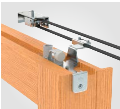
La guida e la cinghia di trascinamento