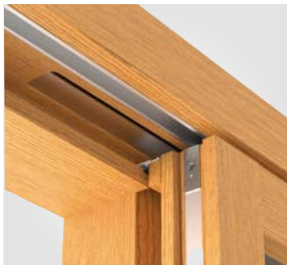
Il profilo di copertura