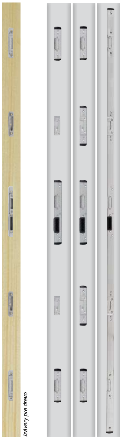
Uzávery pre drevo