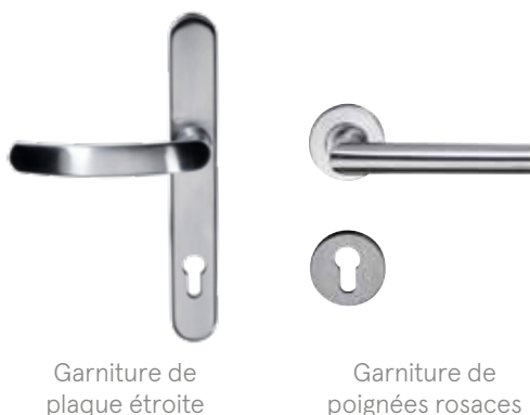
Garniture de plaque étroite