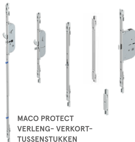
MACO PROTECT VERLENG- VERKORT- TUSSENSTUKKEN

MACO Beschläge BV Stikkenweg 60 7021 BN Zelhem verkoop@maco.eu