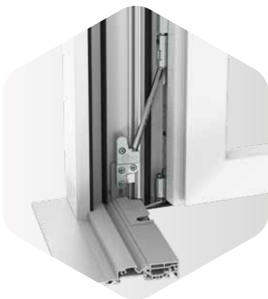
Próg z tworzywowym profilem ramy

Drzwi balkonowe lub tarasowe wpuszczające dużo światła? Dzięki elementowi przenoszącemu obciążenia marki MACO możliwe jest tworzenie drzwi balkonowych o masie do 180 kg – oczywiście z krytymi zawiasami. Dodatkowy element przenoszący obciążenia instaluje się niezwykle łatwo dzięki szablonowi wiercenia – także podczas modernizacji okien. Dodatkową zaletą jest prosty montaż skrzydła na zasadzie Mount & Go. Element odciąża ponadto zawiasy narożne, co znacznie wydłuża ich żywotność.