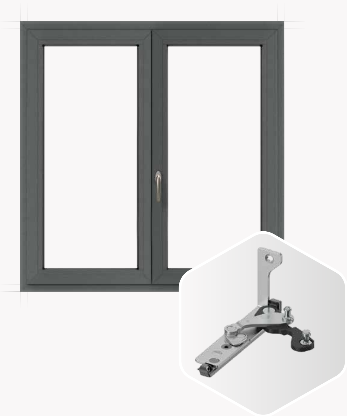
Multi Power z zaciskiem

Kryte okucie do okien aluminiowych z rowkiem okuciowym 16 mm? Proszę bardzo! Okucie Multi Power z zaciskiem jest łatwe w montażu, zgodnie z zasadą "zaciśnij zamiast przykręcać". Może obsługiwać skrzydła o wadze do 120 kilogramów i do 150 kilogramów w przypadku drzwi balkonowych, w zależności od profilu.