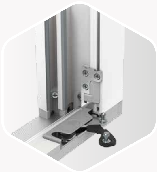
Drzwi balkonowe z progiem