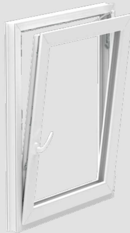
VYKLOPENÍ V CELÉM ROZSAHU