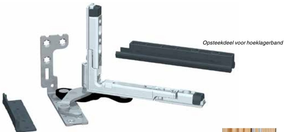
Opvulplaat voor hoeklager