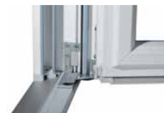
Uitvoering voor kunststof