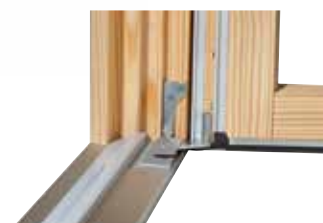
Uitvoering voor hout